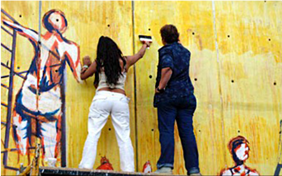
Murales realizados por el colectivo Mujeres en Espiral, creado por mujeres reclusas en Santa Martha Acatitla, como expresión de su encierro pero también de su libertad interior. . Foto | PUEG - UNAM.