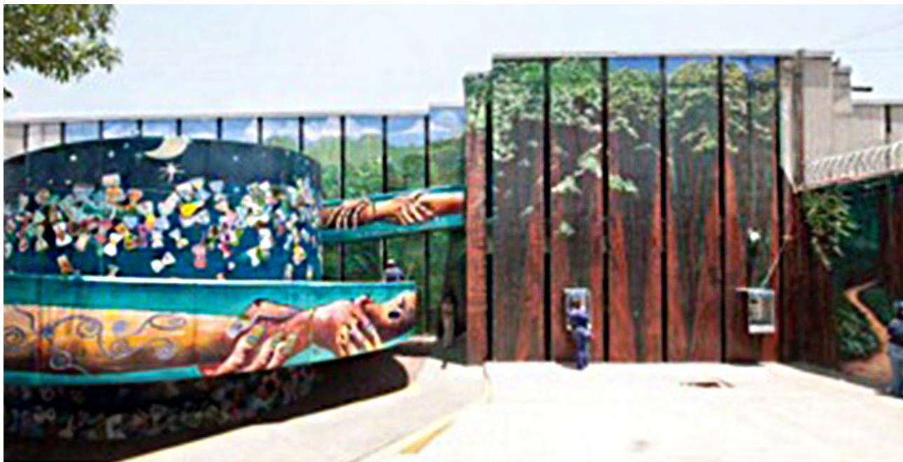
Murales realizados por el colectivo Mujeres en Espiral, creado por mujeres reclusas en Santa Martha Acatitla, como expresión de su encierro pero también de su libertad interior. .