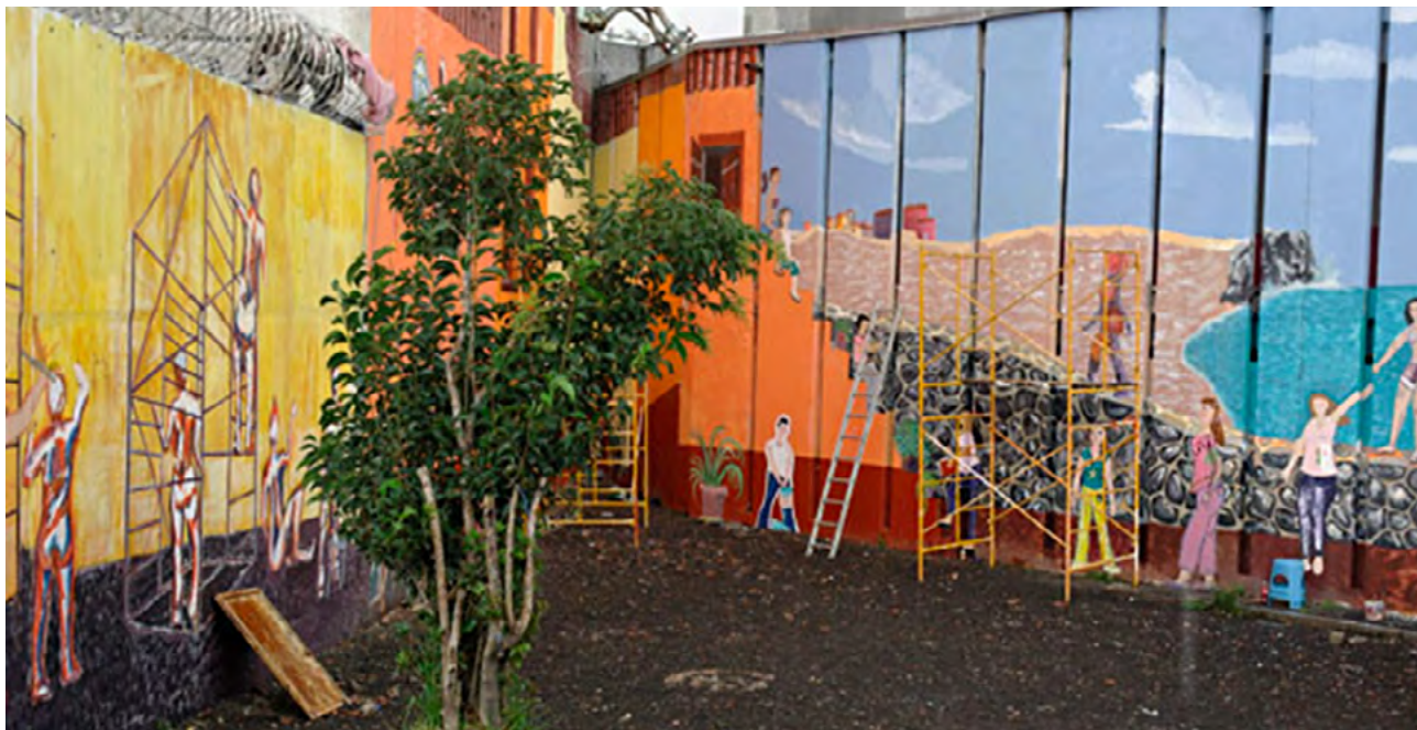
Murales realizados por el colectivo Mujeres en Espiral, creado por mujeres recluidas en Santa Martha Acatitla, como expresión de su encierro pero también de su libertad interior. . Foto | PUEG - UNAM.