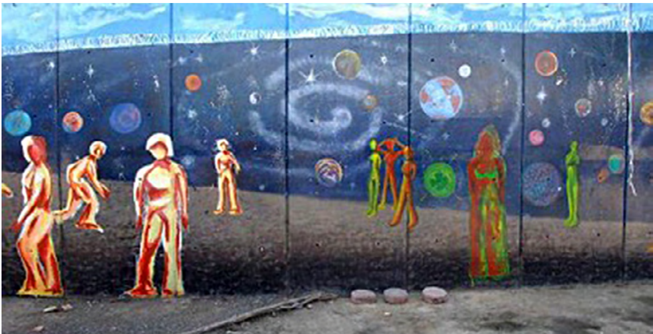
Murales realizados por el colectivo Mujeres en Espiral, creado por mujeres reclusas en Santa Martha Acatitla, como expresión de su encierro pero también de su libertad interior. . Foto | PUEG - UNAM.